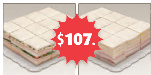
36 Triples Surtidos + 36 Simples J/Q