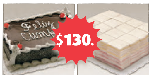
Torta 20 porciones + 96 Copetín J/Q